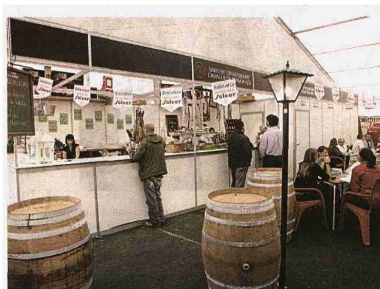
El encuentro se completa con la instalación de casetas de diferentes entidades